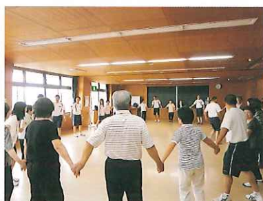
健康A：吉永まちづくりセンター