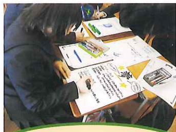
ドリームマップ作り

ウェビングは、頭の中で起こっていることを目に見えるようにした思考ツールで、発想法の一つです。