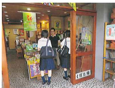
観光B：富士本町商店街