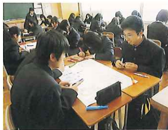
ブレインストーミング

4月の最初に探究学習オリエンテーションを実施しました。ブレインストーミング、KJ法、ウェビングなどの思考ツールを学びました。これらの手法を使って「夢」をテーマにアイデアを出し合い、ドリームマップを作成しました。