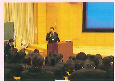
事務長から「市の行政と『協働』」をテーマに、市役所の仕事についてお話を聞きました。