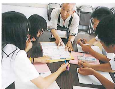
防災A：吉永まちづくりセンター

テーマに沿った場所を訪れ、関係者への聞き取り調査などの体験的な活動を通して、地域に起こっている問題を肌で感じ、課題の本質に迫る機会となりました。