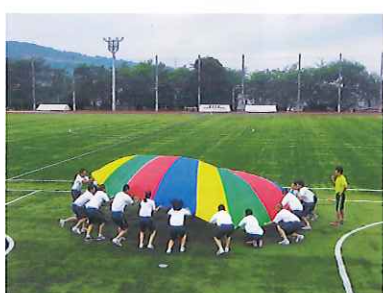
健康C：本校グラウンド