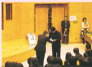
富士市の高校生職員として、辞令を受け取りました。

富士市民として、地域の課題とその現状を知り、その解決に向けて行動する力を育成する「市役所プラン」がスタートしました。